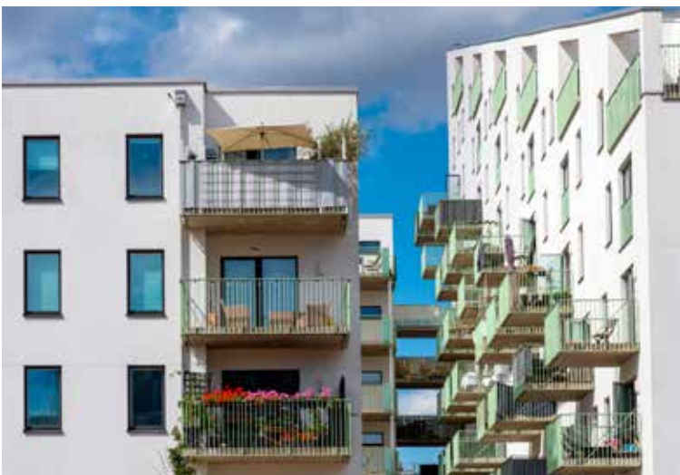
Balkonger och balkongdörrar är en av de viktigaste komponenterna vad det gäller att säkerställa ett gott termiskt klimat i en modern bostad.

Tidsperioden för termiska simuleringar är intimt sammankopplad med vädret. De metoder man vanligtvis använder är antingen en kort dimensionerande period (oftast en dag) eller ett helt år. Dagen kan exempelvis vara när det är som varmast för att ta hänsyn till den värsta kombinationen av utetemperatur, solinstrålning och intern