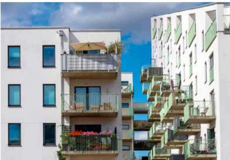
Balkonger och balkongdörrar är en av de viktigaste komponenterna vad det gäller att säkerställa ett gott termiskt klimat i en modern bostad.

Tidsperioden för termiska simuleringar är intimt sammankopplad med vädret. De metoder man vanligtvis använder är antingen en kort dimensionerande period (oftast en dag) eller ett helt år. Dagen kan exempelvis vara när det är som varmast för att ta hänsyn till den värsta kombinationen av utetemperatur, solinstrålning och intern