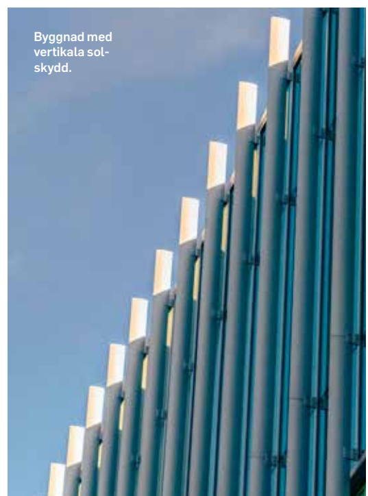
Byggnad med vertikala solskydd.