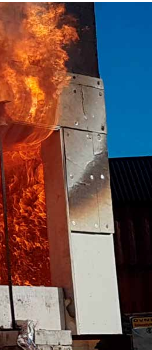
Figur 1: Ett rumsbrandprov (Test 3).

tioner för att stödja detta argument 2 . Denna infallsvinkel grundar sig på resultat från standardiserad brandmotståndsprövning där den termiska exponeringen enligt standardbrandkurvan är fördefinierad, dock bortser man då från det faktum att en brännbar konstruktion kan öka brandbelastningen vilket förändrar brandexponeringen.