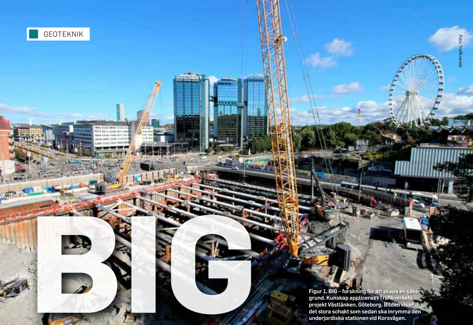
Figur 1. BIG – forskning för att skapa en säker grund. Kunskap appliceras i Trafikverkets projekt Västlänken, Göteborg. Bilden visar det stora schakt som sedan ska inrymma den underjordiska stationen vid Korsvägen.