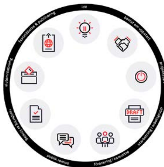
Figur 1. Illustration över standardprocessen.

Efter redigering till följd av kommentarerna från den publika remissen går förslaget till slutomröstning och sist, men inte minst, så fastställs och publiceras standar-