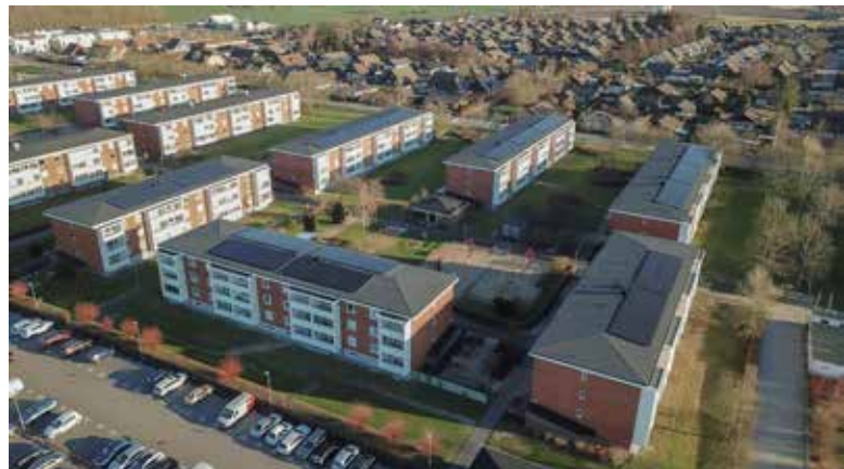
Brf Högalid i Trelleborg.

Uppgifter om årligt elutbyte (elproduktion) behövs för att stämma av lönsamheten, men det kan samtidigt vara svårt att verifiera den uppgiften eftersom den beror på solstrålningen och kräver någon form av normalårskorrigerings. Då är det generellt sett enklare att verifiera anläggningens effekt. Oftast räcker det dock med rimlighetsbedömningar utgående från erfarenhetsvärden med avseende på kWh/år/kW.