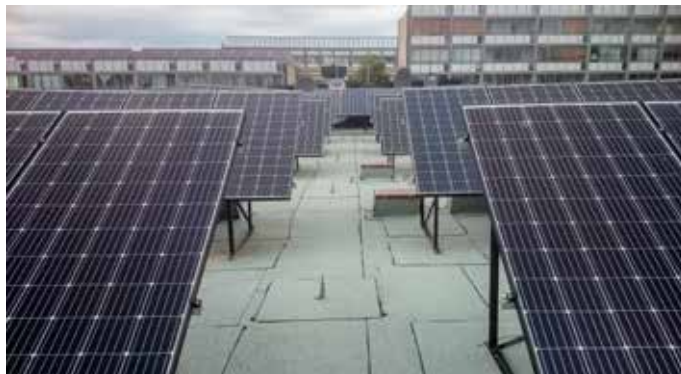
Projekt 2. Plant tak med solcellsmoduler monterad på stativ på en ny takduk.