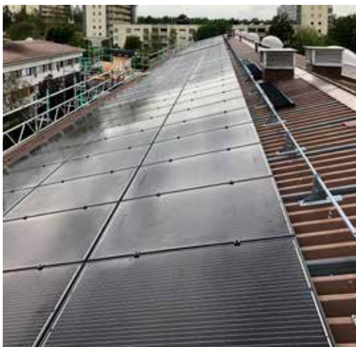
Projekt 3. Lutande plåttak med solcellsmoduler monterad efter takförstärkningar.

» sakta börjar anamma de normer och regler som länge funnits i övriga byggvärlden. För befintliga byggnader behöver också kvalitén på projektering och dokumentation förbättras i entreprenorsledet.