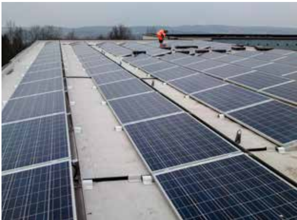
Projekt 1. Plant tak med solcellsmoduler monterad på en ny takduk.