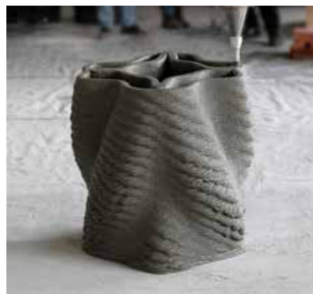
3D-printade betongpelare vid ETH i Zürich. Varje pelare är 2,7 m hög och printades på 2,5 timme.