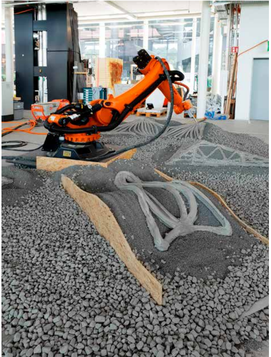
3D-printing av dubbelkrökta betongstrukturer. Roboten skapar först önskad topologisk form på grusbädden och printar sedan betong ovanpå. [RobArch 2018, ETH Zürich].

3D-printat ribb-bjälklag av betong som kan demonteras utvecklat av Block Research Group vid ETH Zürich. Plattan består av fem stycken oarmerade element som via valvverkan kan belastas.