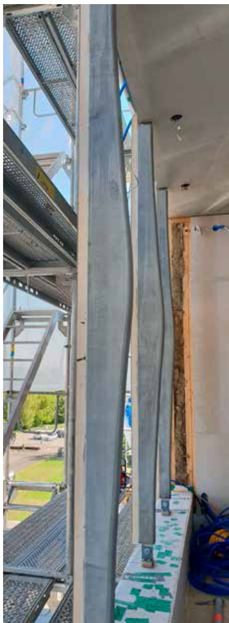
Glidformsgjutna fasadpelare i EMPA House Zürich. Pelare har en geometri som är anpassad efter aktuell lastpåverkan.

Projektet visade att det krävs en utvecklad interaktion mellan människa och robot för att få byggande robotar i reell miljö. Det krävs även ett standardiserat och effektivt digitalt informationsflöde från design till byggd struktur liksom maskinläsbara handlingar och dokument. Robotar måste dessutom vara robusta och tåla slitage, smuts och väta. Generellt krävs kunskap och kompetens kring hantering och programmering av robotar inom bygg. Projektet visade klart att ju tidigare roboten kan introduceras i