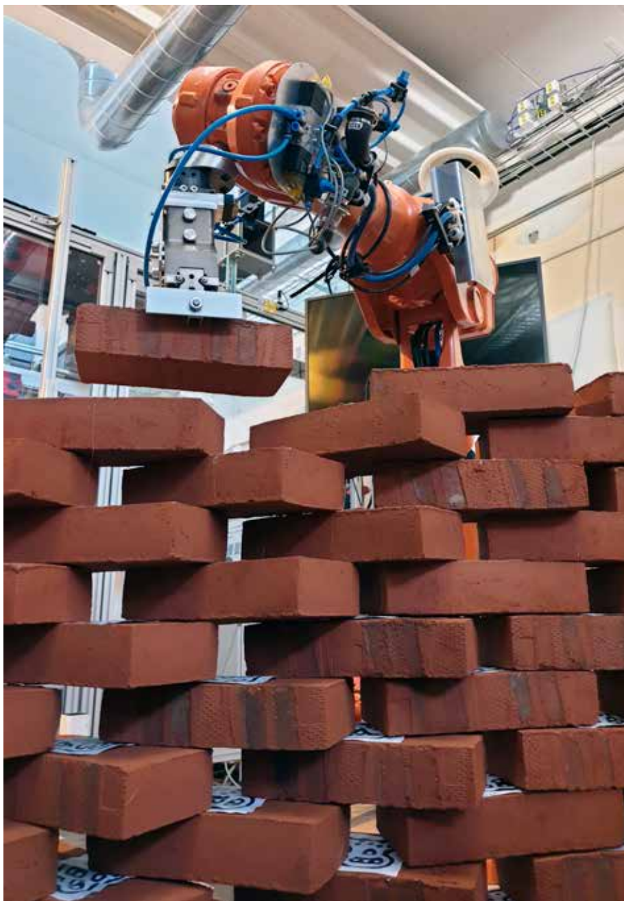
Test av torrurning med ABB IRB 2400 robot vid robotlabbet vid Lunds Tekniska Högskola.